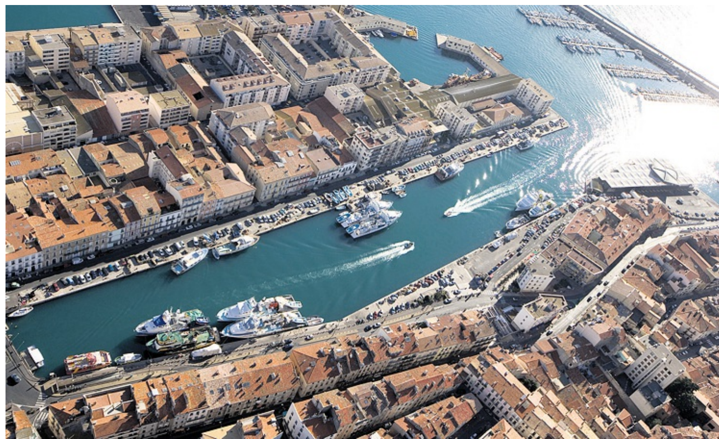
Vue aérienne des canaux de Sète, la ville célébrée par Paul Valéry et Georges Brassens.

Quant à la pêche, qui a permis à la ville de se hisser au premier rang des ports méditerranéens, le match serait nul : les Espagnols auraient apporté la voile et les Italiens la méthode de pêche au chalut avec les bateaux-bœufs, appelés ainsi car ils pêchaient par deux, comme s'ils étaient attelés. Ce mélange de